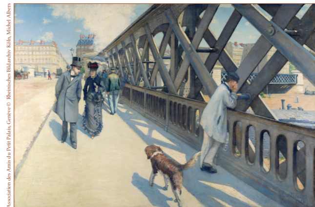
Association des Amis du Petit Palais, Genève