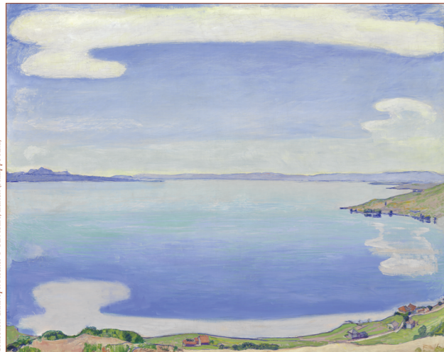
Collection Christoph Blocher © SIK/SEA, Zürich (Philippe Huz)