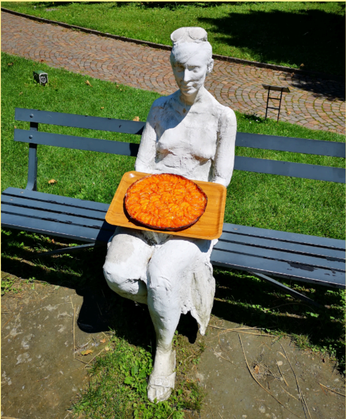
George Segal, Woman with Sunglasses on bench