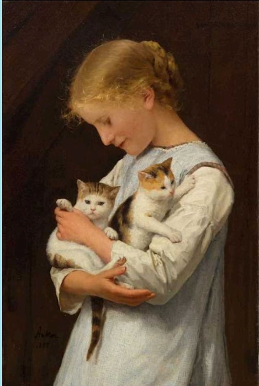
Jeune fille tenant deux chats, 1888 Huile sur toile 66 X 43 cm Sammlung Dr. Christoph Blocher