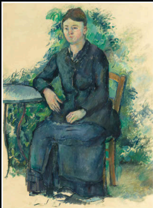
Paul Cézanne, Madame Cézanne at her desk, vers 1888, huile sur toile, 80 x 70 cm, Musée de l'Orangerie

CHEFS-D'ŒUVRE DES COLLECTIONS DES MUSÉES DE L'ORANGERIE ET D'ORSAY