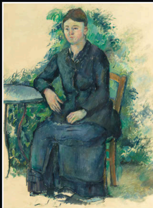
Paul Cézanne, Madame Cézanne au jardin , vers 1880, huile sur toile, 80 x 63 cm, Musée de l'Orangerie

CHEFS-D'ŒUVRE DES COLLECTIONS DES MUSÉES DE L'ORANGERIE ET D'ORSAY