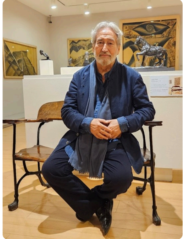
Jordi Savall, à la Fondation Pierre Gianadda le 26 juin 2024

« Dans ma jeunesse, je voulais être artiste - peintre » Jordi Savall