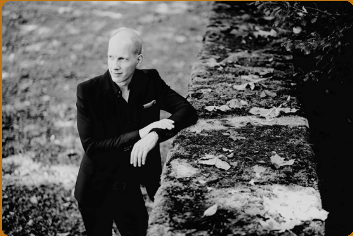
Olivier Cavé © CC BY

« Je ne compte plus mes apparitions dans ce haut lieu de la culture qu'est la Fondation Pierre Gianadda. Il n'y a qu'une chose qui reste et qui restera toujours : cette émotion, ce bonheur magique