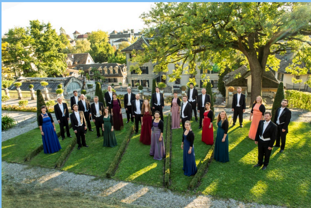
Zürcher Sing-Akademie