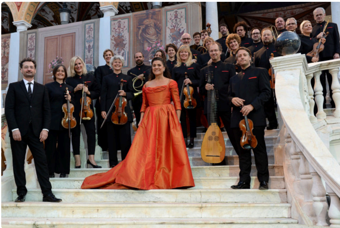
Gianluca Capuano, Cecilia Bartoli / Les Musiciens du Prince-Monaco