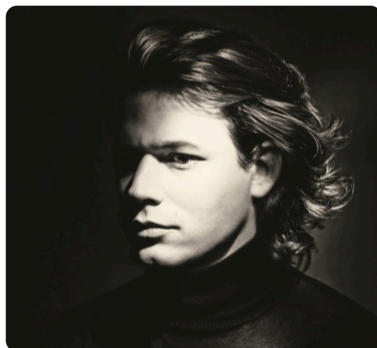
David Fray

Ne manquez pas ce Festival unique en Suisse romande , qui fait de Martigny l'égale de grandes villes musicales telles que Salzbourg, Monaco