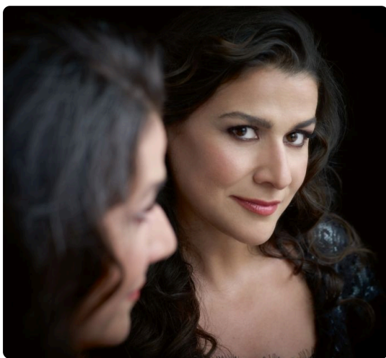
Cecilia Bartoli

Enfin, le festival se refermera le 24 août dans l'intimité d'un récital. Cecilia Bartoli se confiera au piano tendre et mystérieux de David Fray , jeune pianiste prodige français, désigné en 2010, comme « Soliste instrumental de l'année » aux 17 e Victoires de la musique classique. Encore en cours d'élaboration, le programme final vous sera dévoilé au tout début de l'été.