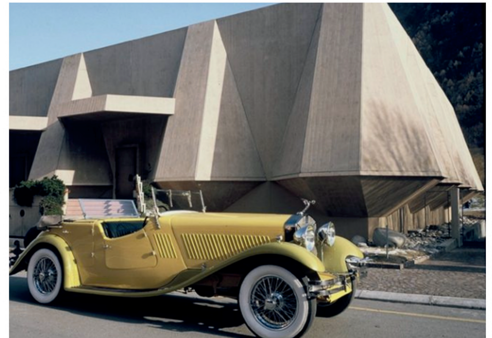
Musée de l'Automobile