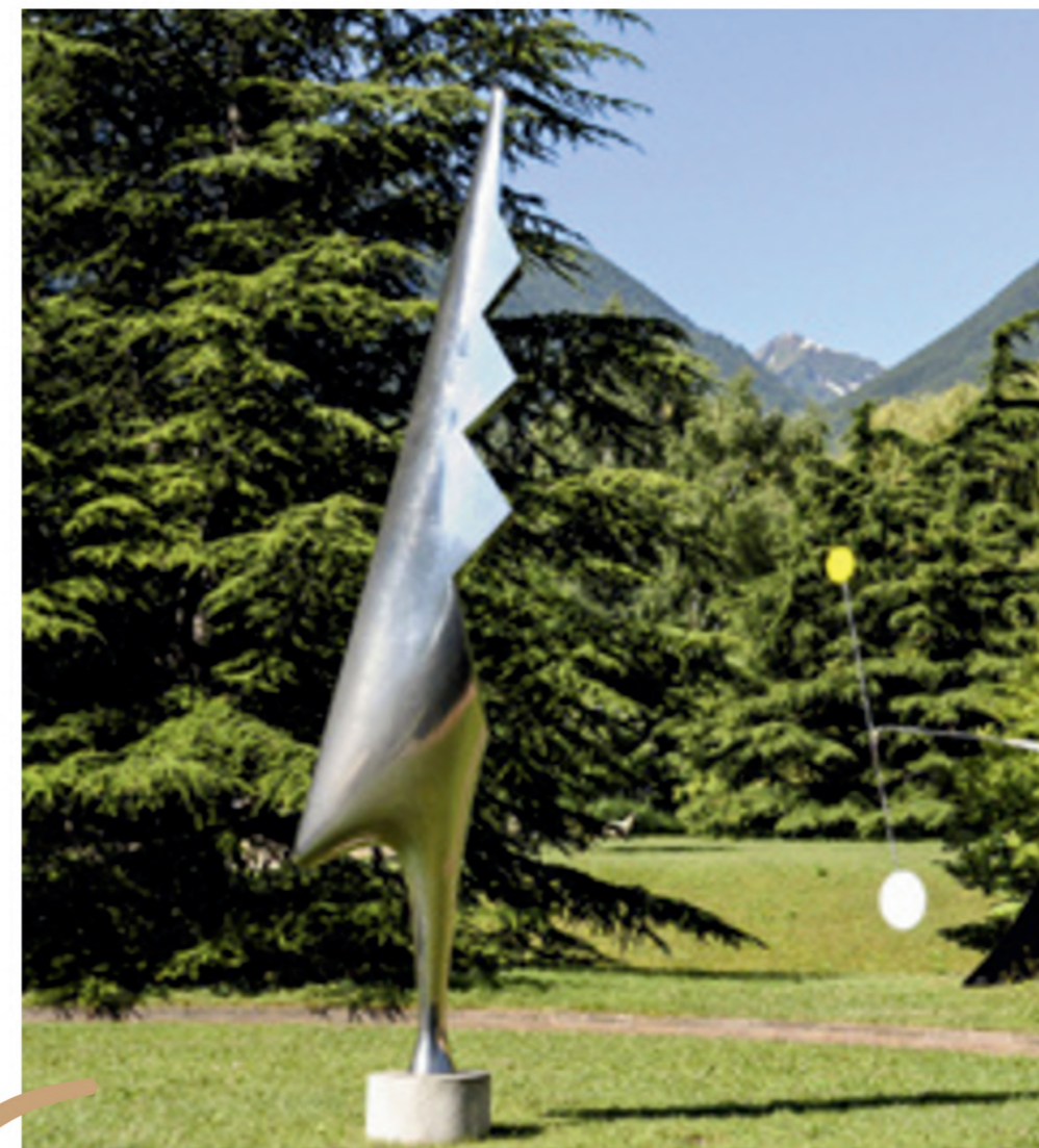
Notre Parc de sculptures